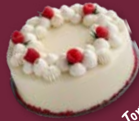
Feine Himbeer-Torte mit weißer Mousse