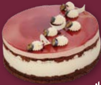
Cassis-Torte mit Knusperboden